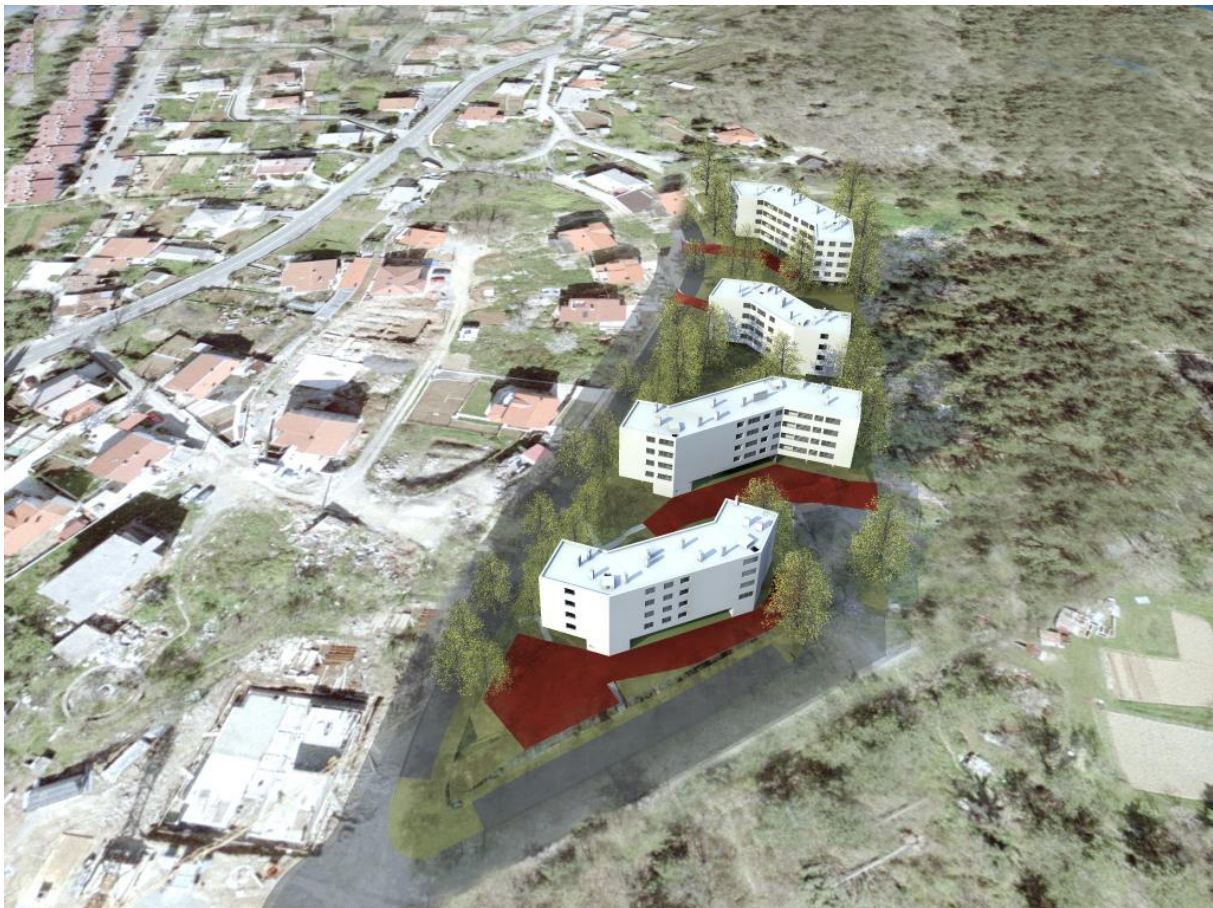
Slika 3. Vizualizacija objekata interpolacijom na orto-foto prikaz

Dok su troškovi izrade projektne dokumentacije poznati, a troškovi komunalnog i vodnog doprinosa te priključenja na komunalnu infrastrukturu precizno procijenjeni, točan iznos troškova građenja znat će se tek po provedbi postupka javne navabe i odabiru glavnog izvođača radova te stručnog i obračunskog nadzora nad gradnjom.