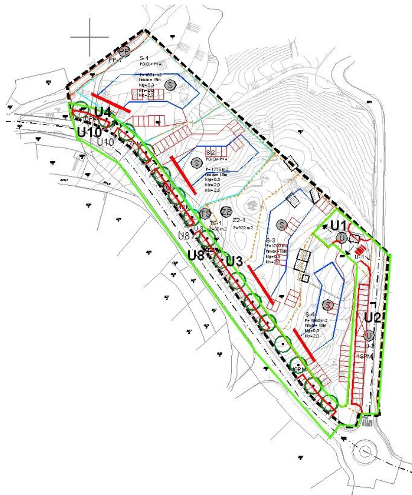
Slika 5. Izvadak iz DPU-a s oznakama zahvata (zeleno)

Za samu realizaciju pristupa potrebno je izvesti radove gradnje i rekonstrukcije pristupnih prometnica, parkirališnih i pješačkih površina, odnosno pristupne prometnice do objekata S-3 i S-4 koja nosi plansku oznaku U-1, rekonstrukciju postojeće prometnice planske oznake U-2 u naravi ceste koja vodi prema starom drenovskom groblju, rekonstrukciju postojeće ulice Brce planske oznake U8, gradnju dijela nastavka postojeće Ulice Brce planske oznake U10, proširenje postojeće ulice Brce novim parkirnim mjestima planskih oznaka U-3 i U-4, a koji troškovi se smatraju troškovima uređenja komunalne infrastrukture u smislu članka 6. stavka 2. i članka 7. stavka 2. Zakona.